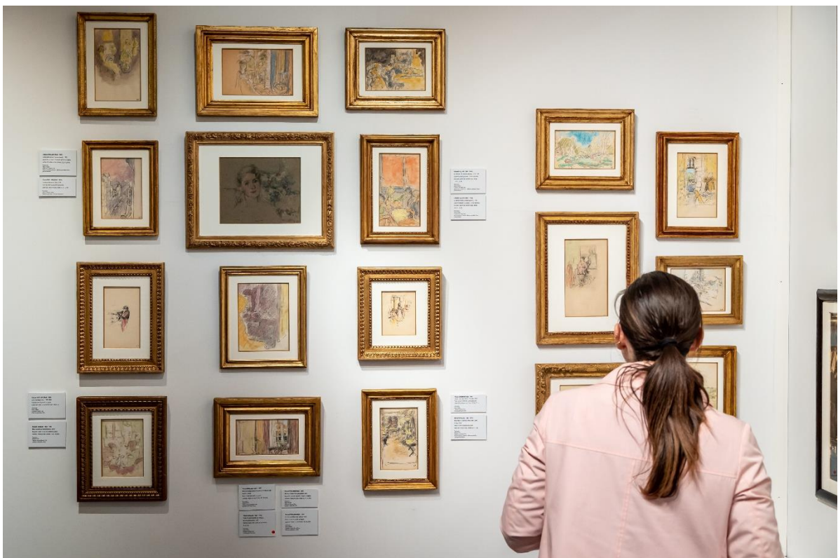
Les dessins de Vuillard exposés à la galerie Alexis Pentcheff