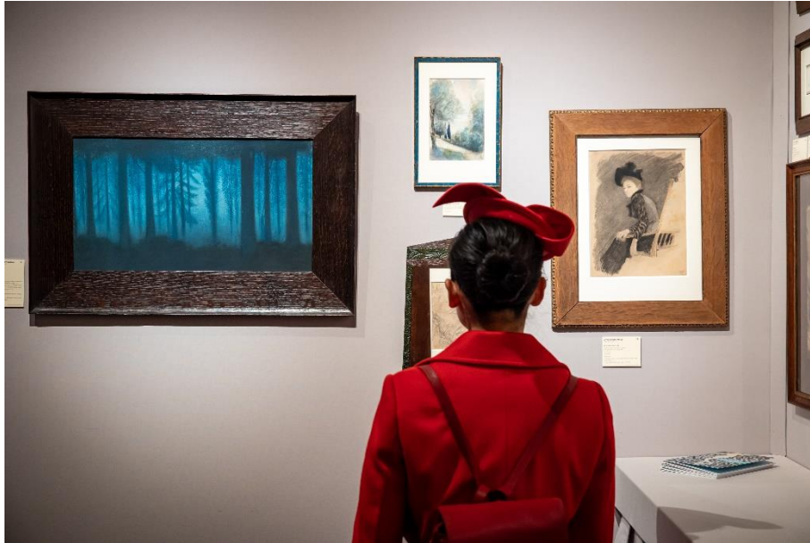
Lancz Gallery au Salon du dessin 2023

« Nous avons eu plus de collectionneurs américains qu'à la TEFAF la semaine dernière, ces derniers ayant préféré Paris plutôt que Maastricht, notamment pour son offre culturelle » commentait Antoine Laurentin qui revenait de la foire hollandaise, preuve que les troubles sociaux n'ont pas effrayé les acheteurs. Une constatation vérifiée dans les allées du Salon du dessin.