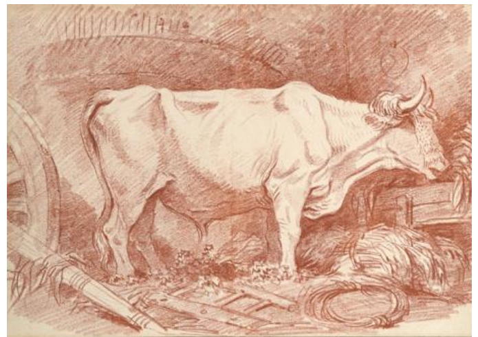
Jean-Honoré Fragonard (1732-1806) Boeuf dans une étable, Sanguine 35,3 x 49 cm