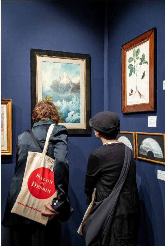
Galerie Grand Rue Marie-Laure Rondeau