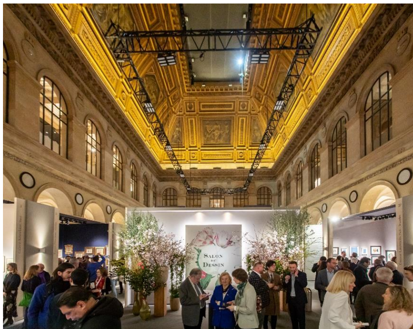
Salon du dessin 2023

Le Salon du dessin a attiré plus que jamais les conservateurs de musées du monde entier qui se pressaient dès le vernissage aux côtés des collectionneurs à la recherche de pépites, revenant à son niveau de fréquentation d'avant la crise du COVID (2000 visiteurs pour le seul vernissage). Toutes les institutions étaient de retour, du Getty de Los Angeles au British Museum de Londres, en passant par le Met de New York, l'Art Institute de Chicago, le Harvard Art Museum, la Menil Collection de Houston, et les musées européens de Hambourg, Francfort et Zürich, les mécènes du Rijksmuseum, et bien sûr le Louvre, le musée d'Orsay, les musées de Lyon et d'Orléans entre autres. Il faut dire que l'ambiance et l'atmosphère du Salon du dessin, saluées par tous les visiteurs quels qu'ils soient, entretenues et partagées par les exposants, en font un rendez-vous que l'on ne manquerait pour rien au monde !