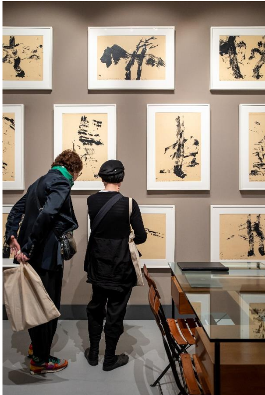
Waddington Custot © Tanguy de Montesson