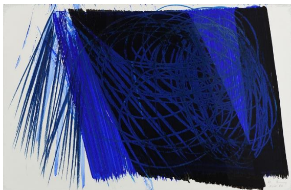
Hans Hartung (1904-1989) PM1972-15, 1972 Acrylique et pastel sur carton baryté signé daté Hans Hartung Noël 72 32 x 50 cm Galerie Berès