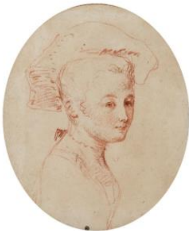
Jean-Antoine Watteau (1684-1721) Tête de jeune femme vue de trois quarts coiffés d'un grand bérêt Sanguine sur papier crème de forme ovale 16,6 x 14 cm De Bayser

A la galerie Eric Coatalem , le dessin représentant « Deux cosaques », pierre noire, sanguine, lavis brun et rehauts de blanc de Jean-Baptiste le Prince (1734-1781) trouvait très vite preneur. Le même sort était réservé au spectaculaire dessin d'Alessandro Allori dit il Bronzino (1535-1607) présenté par la galerie Terrades , « Deux âmes entre un ange et un démon », vers 1560, réinterprétant un motif tiré du Jugement dernier, vendu au-dessus de 100.000€.