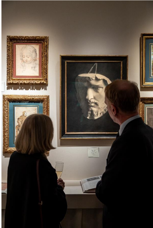
Didier Aaron & Cie © Tanguy de Montesson