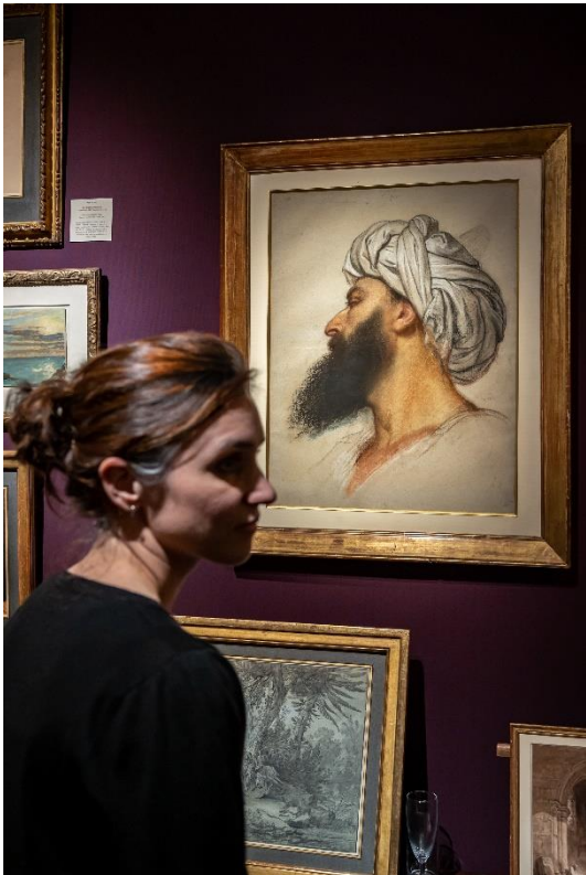
De Bayser © Tanguy de Montesson