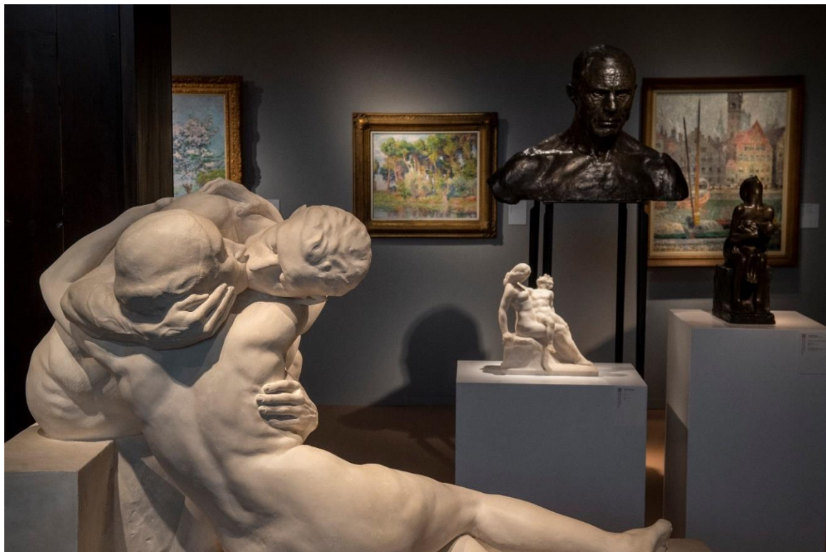
BRAFA Art Fair 2022 - Francis Maere Fine Arts