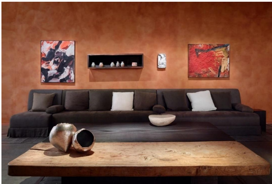
BRAFA 2022 - Axel Vervoordt