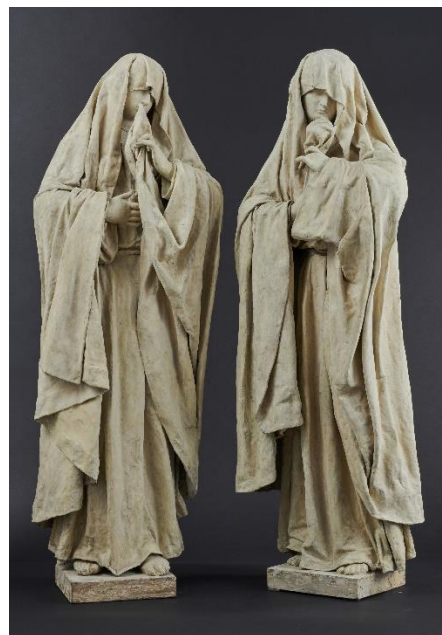
Figures de pleurantes, Décor d'une grande « machine » funéraire, bois, plâtre et tissus France, Fin du XVIIe siècle, H 91 – L 33 - P 18 cm