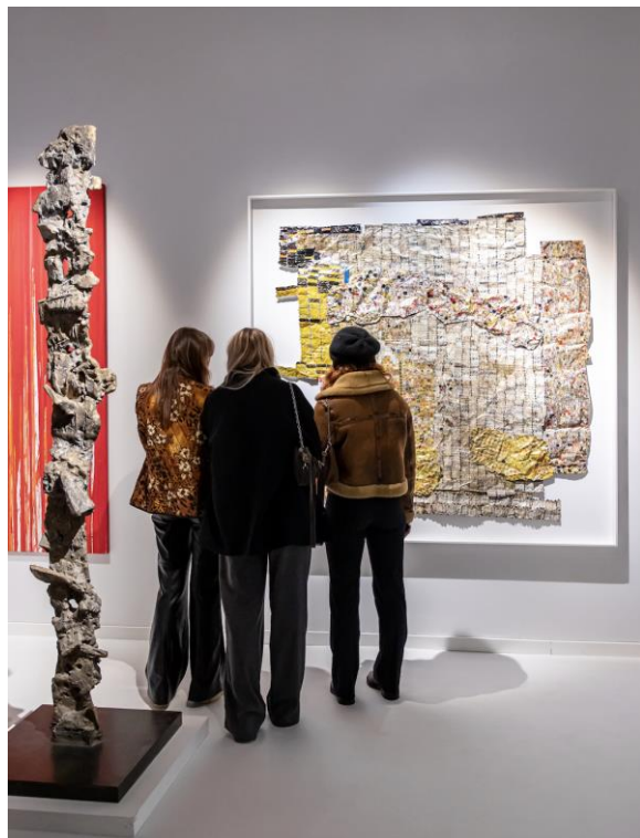
Galerie RX Fine Arts Paris & La Biennale 2022