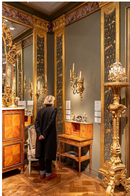
Galerie Léage Fine Arts Paris & La Biennale 2022