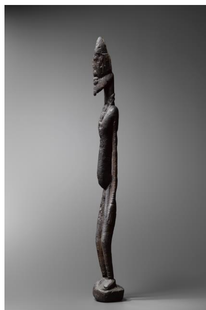
Statue Soninke Dogon, Mali falaise Bandiagara, Bois, hauteur 90 cm