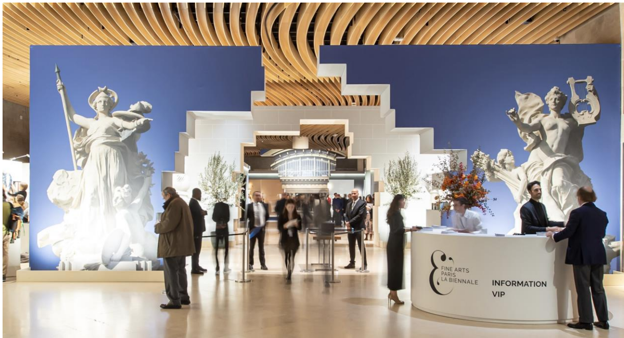
Fine Arts Paris & La Biennale, novembre 2022

L'atmosphère, la beauté, la diversité et la cohérence des stands, appréciées unanimement par les visiteurs, sont à elles seules un signe excellent des perspectives de croissance de l'évènement. Avec plus de 17000 visiteurs , malgré une journée de grève et un jour férié, la première édition de Fine Arts Paris & La Biennale, qui a réuni 86 exposants aux goûts subtils et exigeants, a conquis amateurs, collectionneurs et conservateurs d'institutions. Les musées français et étrangers comme celui de l'Art Institute de Chicago , la National Gallery de Washington , le Getty de Los Angeles mais aussi de grands décorateurs et collectionneurs étaient au rendez-vous. La prochaine édition, du 21 au 26 novembre 2023 au Grand Palais Ephémère , offre des perspectives prometteuses sur le marché de l'art international.