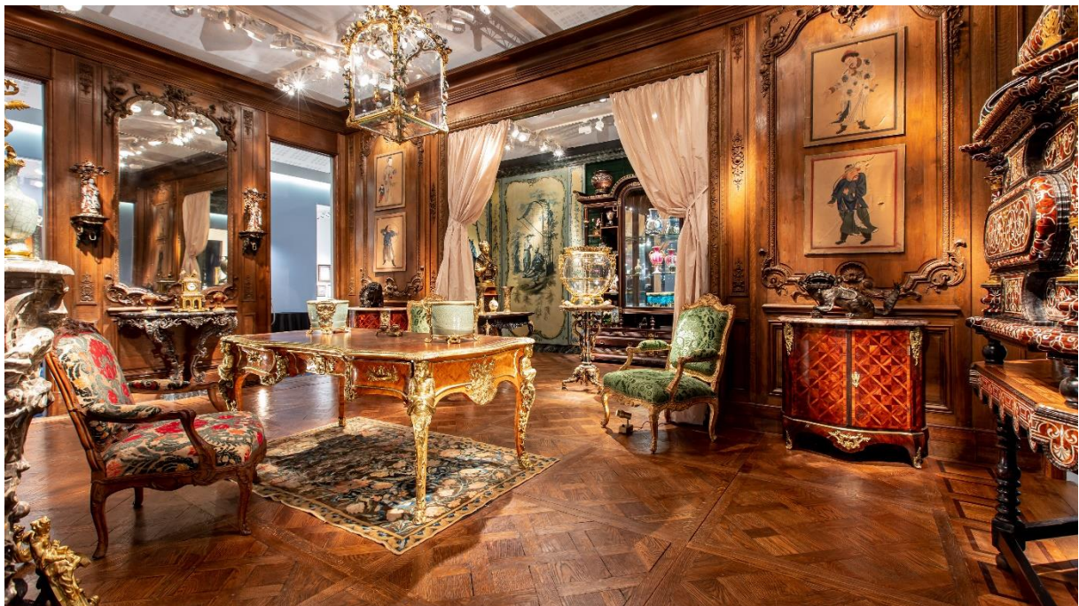
Galerie Steinitz, Fine Arts Paris & La Biennale 2022