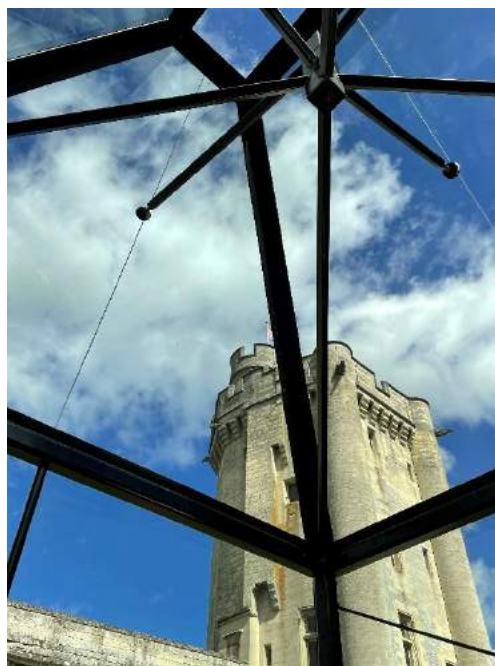
Odile Decq, Pavillon noir , 2019 - Acier, aluminium, et verre - 570 x 350 x 350 cm