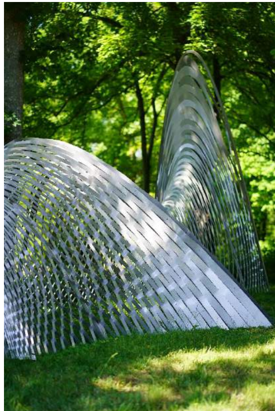
Kengo Kuma, Owan, 2016