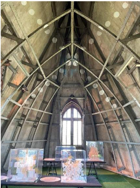
Les maquettes dans la salle Eiffel du Donjon de Vez