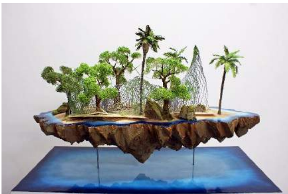
La Fratrie, Sand Castle for Eternity and Beyond , Kengo Kuma revisité