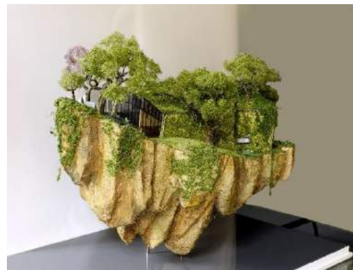
La Fratrie, King of the Hill , Rudy Ricciotti revisité