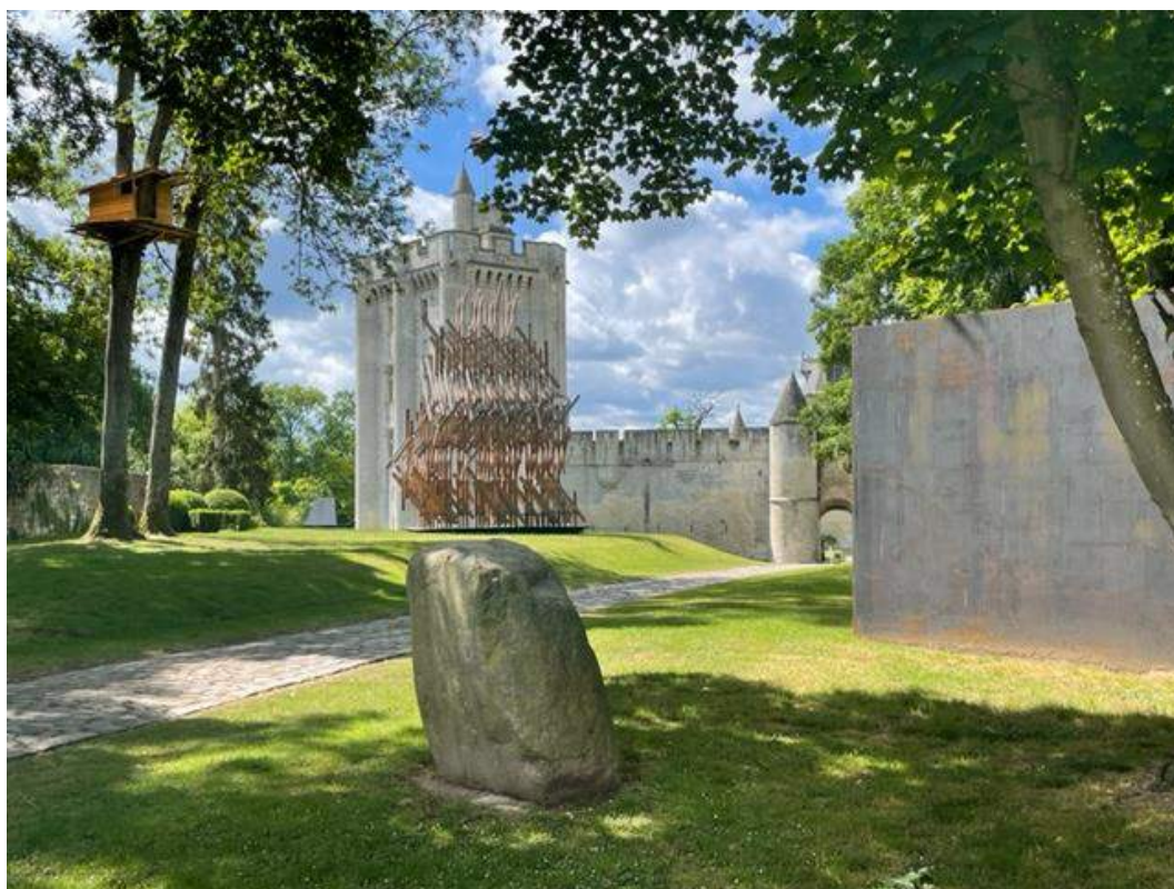
Donjon de Vez – Lee ufan – Tadashi Kawamata – Kengo Kuma

Haut-lieu de l'histoire du Valois, berceau originel des rois de France, le Donjon de Vez fait dialoguer le Moyen-Âge et l'art contemporain depuis 30 ans.