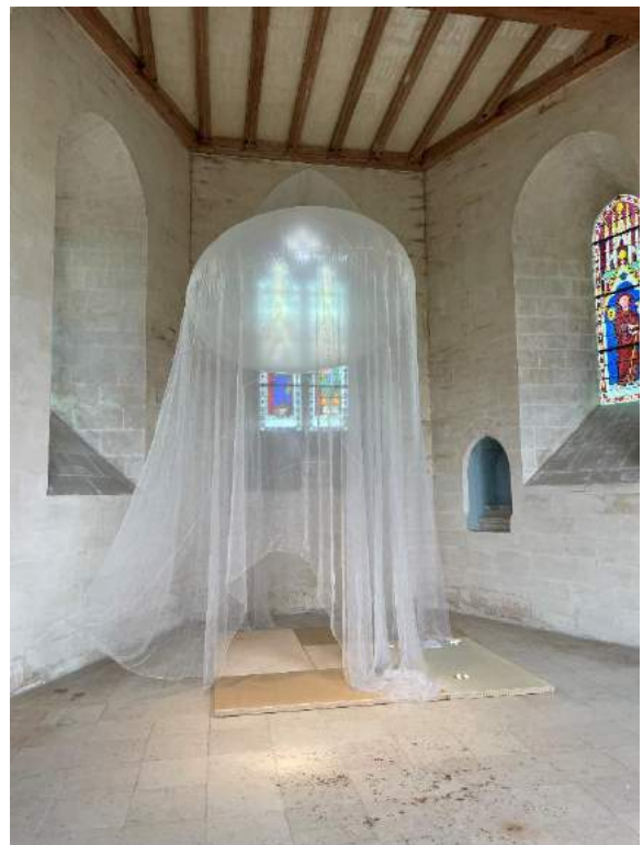
Kengo Kuma, Fu-An